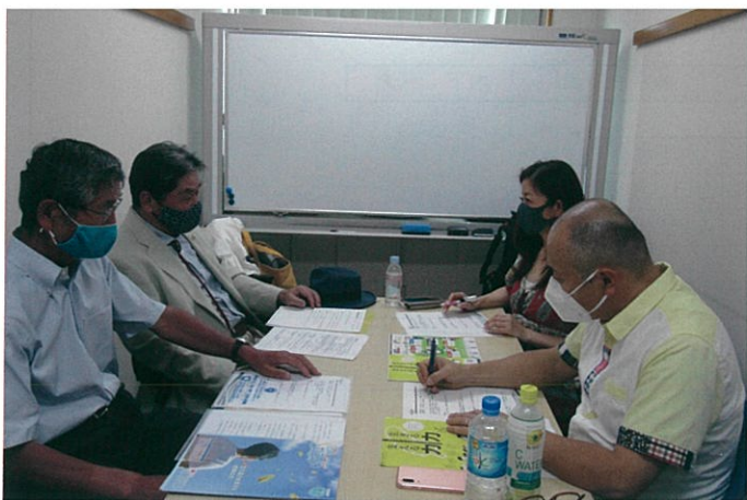
打ち合わせの様子

東播磨地域エリアで約43万人の住民へ向け、FMラジオとサイマルラジオ(インターネット放送)などを通じて放送されている番組です。