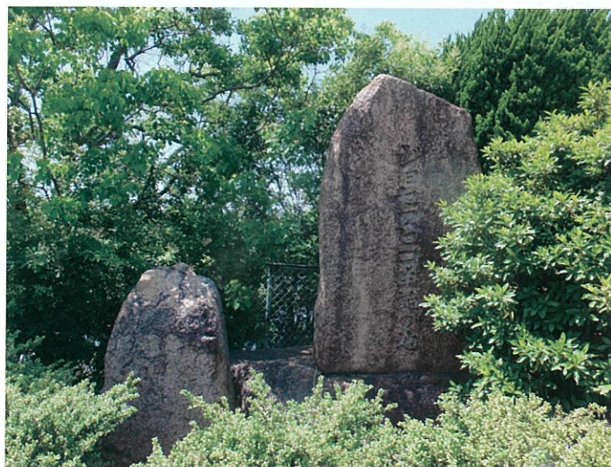
新聞の父ジョセフ・ヒコ(浜田彦蔵)の生誕地は播磨町!!

元治元年(1864年)、外国人排斥の危険な風潮が広がる中、外国の実情を伝えたいとの強い思いから日本初の民間新聞『新聞誌』を発行。子どもにも読める平易な文章、定期的な発行、広告の掲載など今日の新聞の土台を築いたとして高く評価されています。