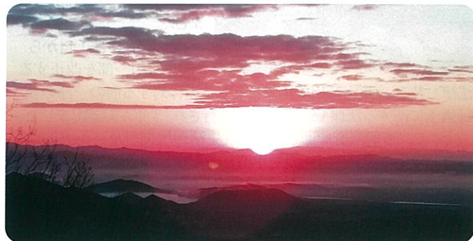
高御位山 初日の出

ニアの大会に参加しています。練習は多木化学（株）さんのテニスコートを借りてやっています。今年は 5 月の近畿選手権大会 65 才以上の部で準優勝で