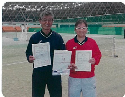
近畿選手権大会 65才の部 準優勝（長浜ドーム）

ニアの大会に参加しています。練習は多木化学（株）さんのテニスコートを借りてやっています。今年は 5 月の近畿選手権大会 65 才以上の部で準優勝で