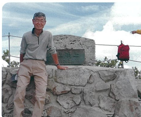
伯耆大山 頂上にて

ソフトテニスの合間に山登りをしています。20代から山登りはしていましたが、3年前から高御位山遊会という山のサークルに入り、近くの山や、7月下旬から8月にかけては夏山登山として信州の山にでかけたりしています。今年の高御位山からのご来光の写真を載せました。山では日